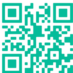
As de guía